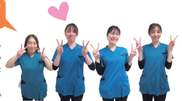
教育担当 新人看護師 プリセプター チームリーダー